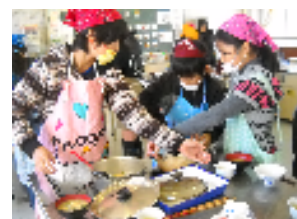
自分たちでつくったお米で調理実習