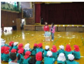
ゆうき幼稚園の園児と交流会