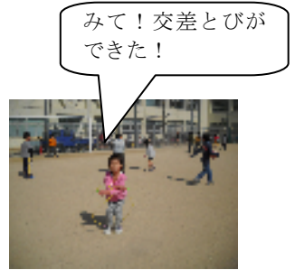
BくんとAくんのかわい いシュートシーン