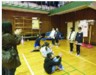
学習の成果を堂々と発表した小学校生活最後の授業参観

その6年生の教室には、『卒業まであと〇日』のカウントダウンカレンダーが掲示してあります。(2月26日現在、『あと15日』だそうです)3月1日(金)の3・4校時には、在校生が6年生に感謝とお祝いの気持ちを表す「6年生を送る会」が開催されます。